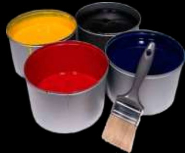
Pintura, solventes resistolos y accesorios