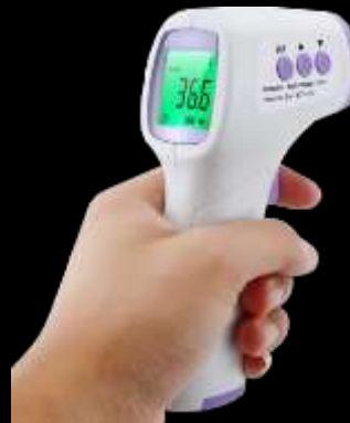
Suministros para Covid-19