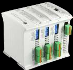
Eléctrico, electrónica y especializados