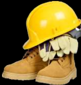
Uniformes y equipo de seguridad