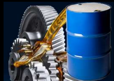
Desengrasantes y lubricantes