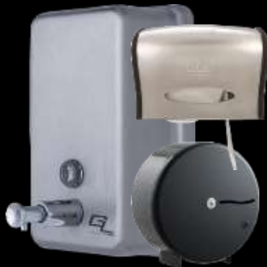
Suministros y equipamiento para baños