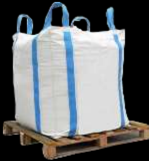
Materia prima y tarimas