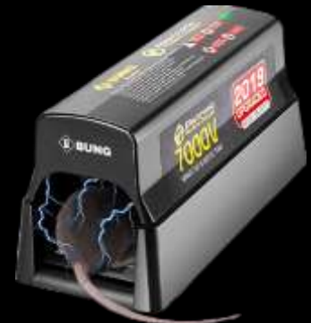
Control de Plagas