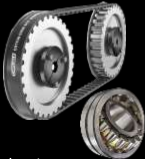
Rodamientos, engranes Y bandas