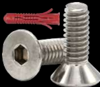
Taquetes y tornillería