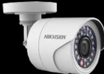
Cámaras de seguridad