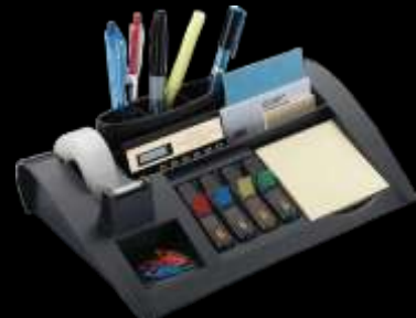
Equipo de oficina suministros